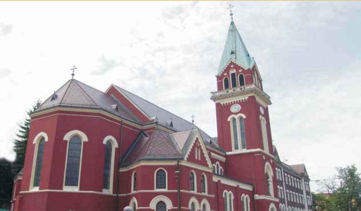
Crkva i samostan sv. Ante na Bistriku