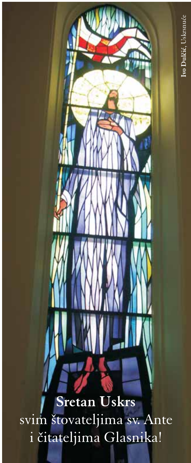
Ivo Dulčić, Uskrsnuće