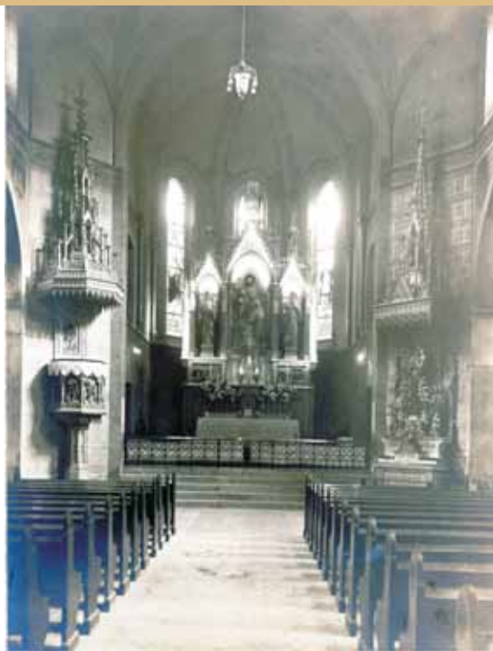
Stara crkva sv. Ante početkom 20. st.