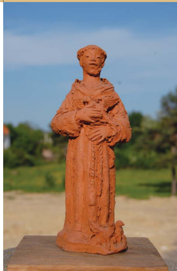
Pavo Perić, Sveti Franjo

Novac nije, smatraju oni, nikada imao stvarnu vrijednost, nego je počivao na temelju povjerenja u njegovu realnu vrijednost. Kad je to povjerenje razrušeno različitim i običnim ljudima često nerazumljivim novčarskim malverzacijama, bilo je samo pitanje kad će cijeli sustav doći u pitanje. Opća kriza povjerenja stoga je uzrok recesiji. A kad se ona opet uveže s već stoljećima prisutnom krizom kršćanskoga identiteta te s krizom same ideje Europe, koja je kršćanskoga podrijetla, onda je ona sama po sebi razumljiva.