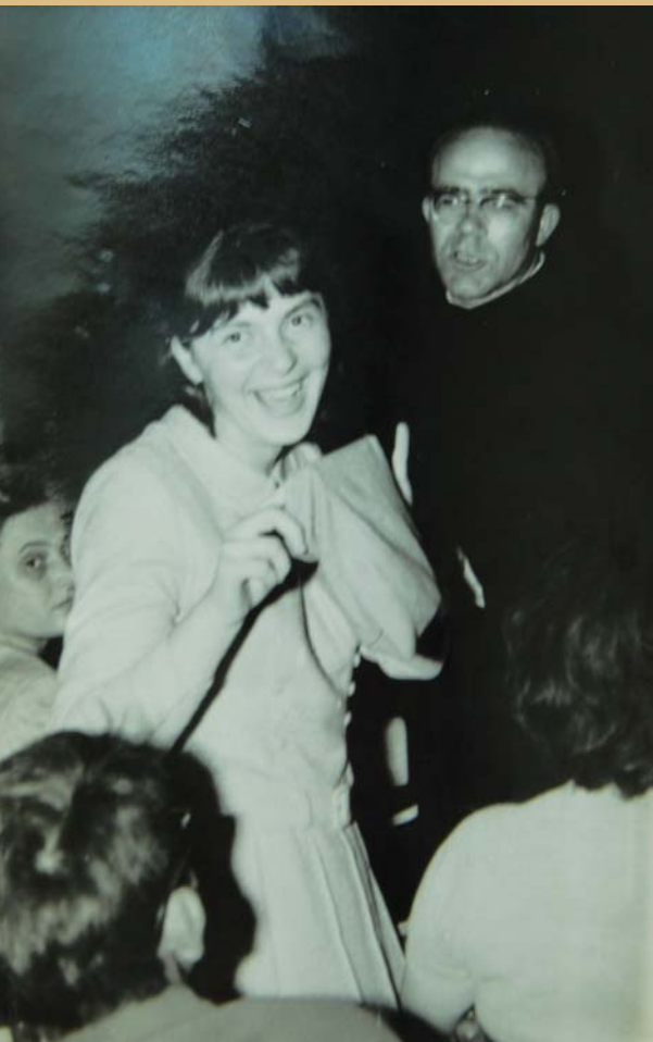
Prikupljanje mlodara za izlet