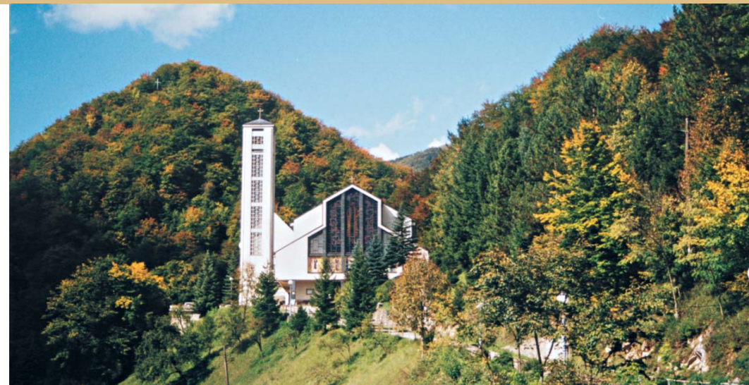
Franjevački samostan i crkva sv. Katarine u Kreševu

U vrhu kuhinje lijevo opet mala vrata za dvije ženske sobe, nalik na sobice za lutke. Na drvenim podijima ispod prozora, koje smo prozvali jasje, rasporedile smo posteljine koje su priredile naše mame i uz smijeh radosti, zadovoljne viđenim, počele se dogovarati oko svojih dnevnih dužnosti.