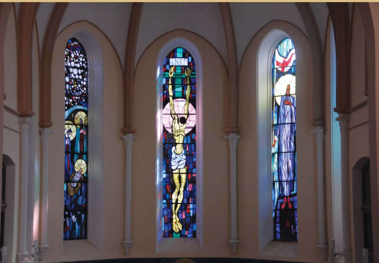
"Nadjenu mu ime Isus jer će on spasiti narod svoj od grijeha njegovih"