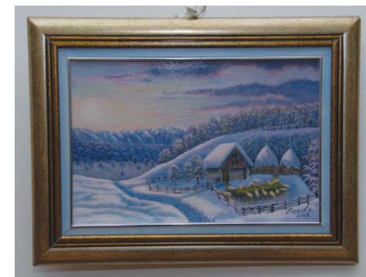
Sekula Dugandžić, Sutton I, (ulje na lesonitu)