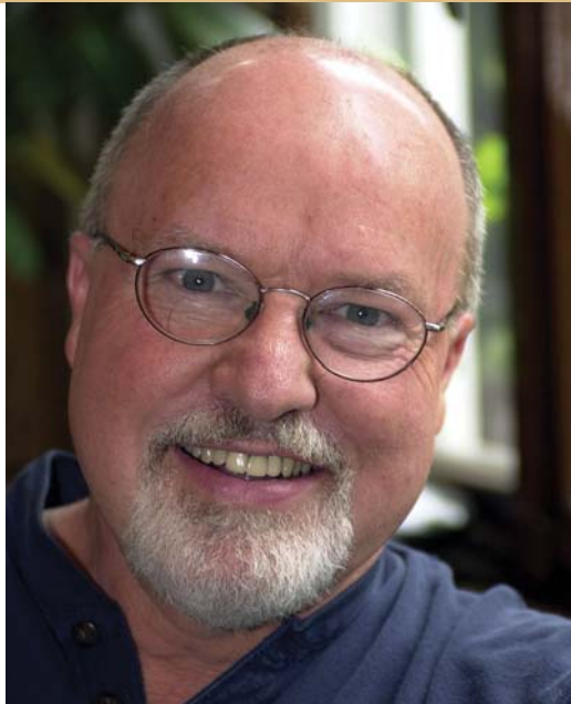
Fra Richard Rohr