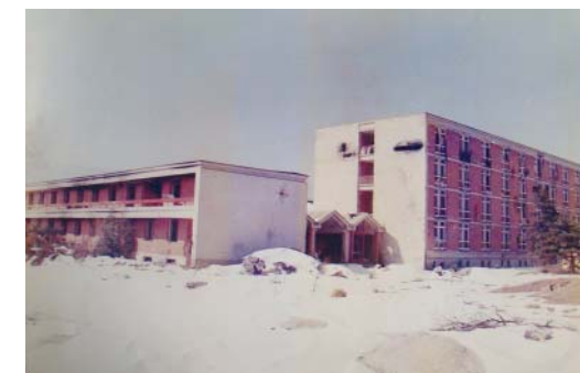
Teologija nakon nedavnog rata

Ovakav rad režijske grupe pokazao se vrlo uspješnim tako da je vrijednost izgrađenih objekata sa svim priključcima na postojeće komunalne instalacije i dio pristupnog puta bio za dva i pol puta jeftiniji nego što bi tada neko građevinsko poduzeće izvelo te iste radove; slobodno se može reći da je to bilo izuzetno uspješno za ono doba gradnje, upravo nevjerovatno.