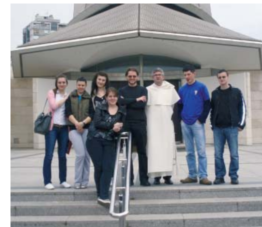
Susret franjevačke i dominikanske mladeži