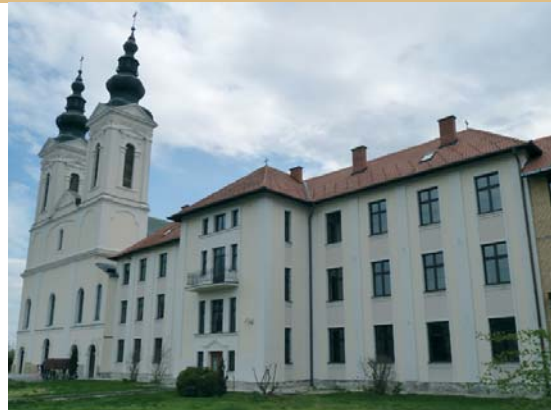
Crkva i franjevački samostan u Tolisi