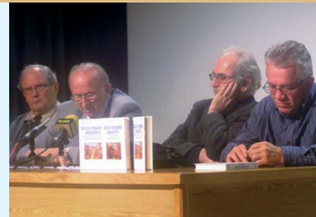
S promocije djela S.S. Kranjčevića u izdanju Matice hrvatske Sarajevo

Slovensko kulturno društvo Cankar iz Sarajeva priredilo je 9. travnja 2010. u Maloj galeriji sv. Ante koncert muškoga pjevačkog zbora Ljubečna iz istoimenog mjesta pokraj Celja. Na repertoaru koncerta, koji je priređen za članove ovoga slovenskog kulturnog društva, a kojemu je bio nazočan i veleposlanik Slovenije u Bosni i Hercegovini gosp. Andrej Grasselli, izveden je rukovet slovenskih narodnih pjesama te pjesama što su ih skladali neki istaknuti slovenski glazbeni umjetnici.