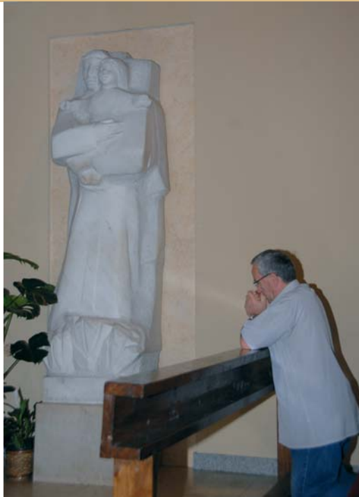
Molitva svetom Antu