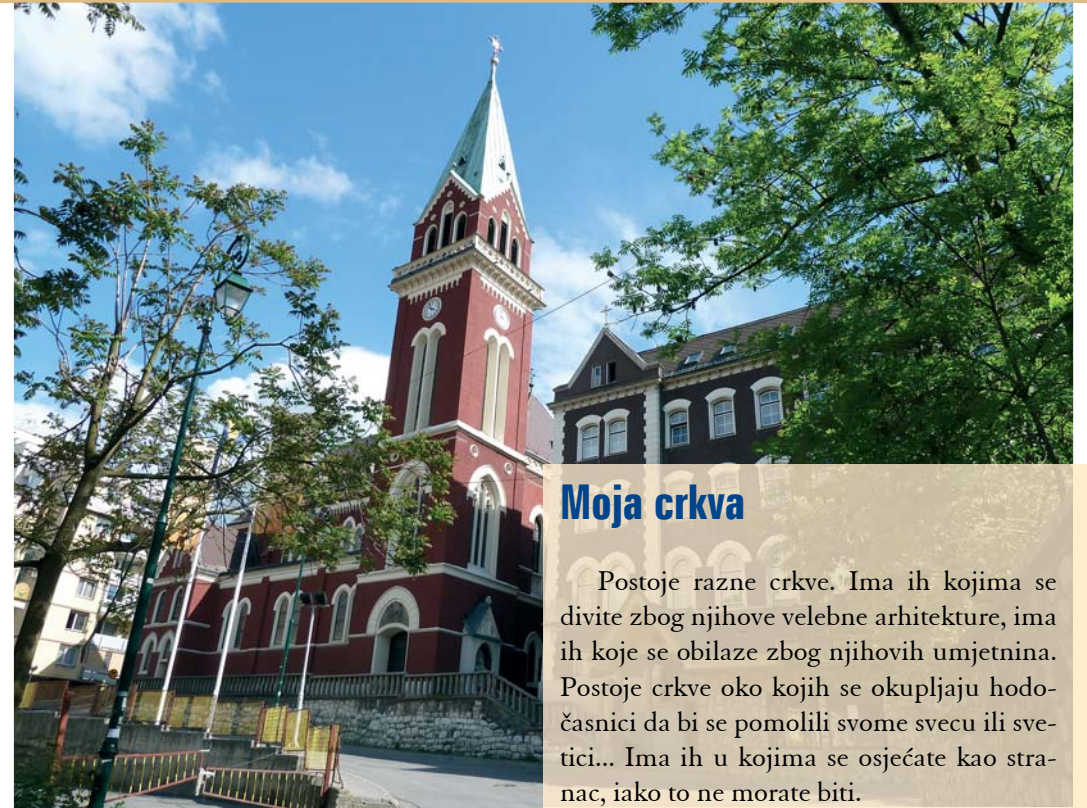
Crkva sv. Ante na Bistriku

Dobro poznavanje Pisma sv. Anto će u svojim mnogobrojnim strastvenim propovijedima podijeliti s drugima. Suvremenici ga opisuju kao velikog propovjednika kojega su