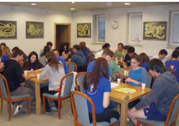
S turnira u Čovječe, ne ljuti se

U četvrtak 6. svibnja 2010. godine, u Franjevačkom međunarodnom studentskom centru na Kovačićima, Frama Sarajevo organizirala je turnir u igri Čovječe ne ljuti se . U svom uobičajenom terminu, četvrtkom u večer, koji je rezerviran za susrete Frame, framaši su odlučili napraviti i organizirati zabavnu večer druženja uz natjecanje u igri. Uvijek atraktivna i svim uzrastima zanimljiva igra privukla je pozornost mnogih mladih te je tako do dana igranja bilo prijavljeno trideset i dvoje natjecatelja.