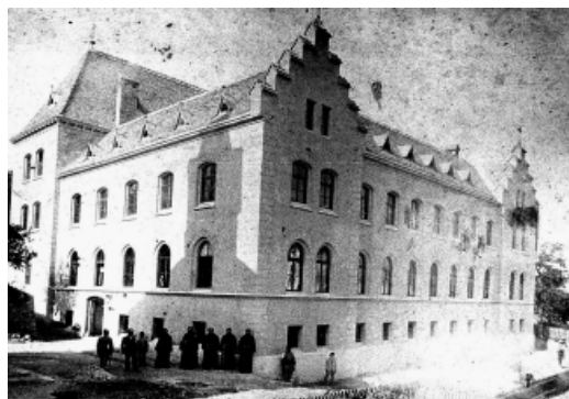
Samostan sv. Ante oko 1910. godine

Kada je, naime, 1889. dovršena gradnja današnje sarajevske katedrale, vratili su se franjevci u blizinu svoje crkve sv. Ante. Smjestili su se u Hendinu ulicu. „Mijenjanje stana ne bijaše ugodno, a ni iz drugih razloga probitačno. Zato se redovničko starješinstvo a i drugi odlučujući čimbenici počеше baviti mišlju, kako da se sazida vlastiti dom“, piše dr. Franjo Blažević. U njihovoj ih je potihoj želji i nakani još više učvrstila vatra koja je četiri dana pred Božić buknuła na tavanu njihova stana i proširila se na druge prostorije ostavivši neoštećenim samo prizemlje.