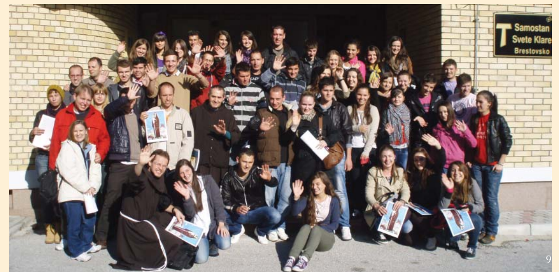
Mladi s Bistrika u Brestovskom