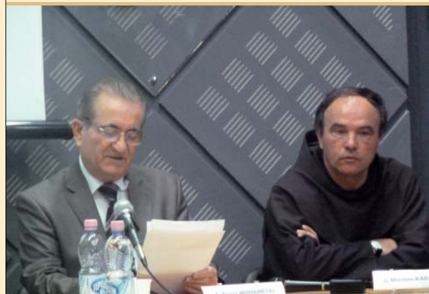
Sa znanstvenog skupa o fra Gjergju Fishti