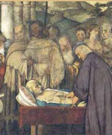
F. Vecellio, Čudo s lihvarovim srcem