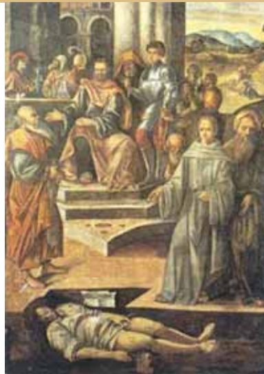
B. Montagna, Sveti Anto uskrisava mrtvuca