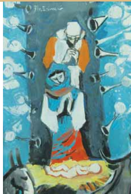
Vlatko Blažanović, Rođenje