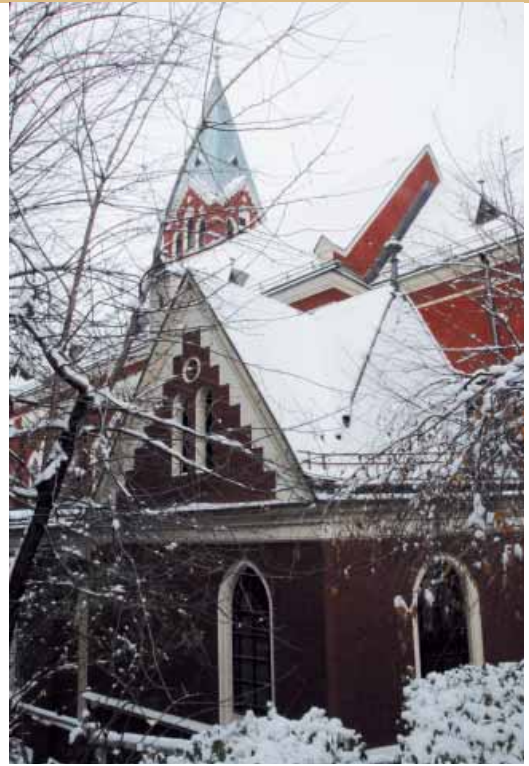
Sakristija crkve sv. Ante na Bistriku

Vjeroučitelj je počeo s pričama čiji su temelji počivali u Svetom pismu, a mi smo ih pažljivo upijali slušajući i pamteći - poruke. Svaki sat vjeronauka, jedna priča i nekoliko prigodnih pouka, ali onih stvarnih, koje je svakako dobro upotrijebiti (nije bilo preporuka mora se ) u svakodnevnom životu.