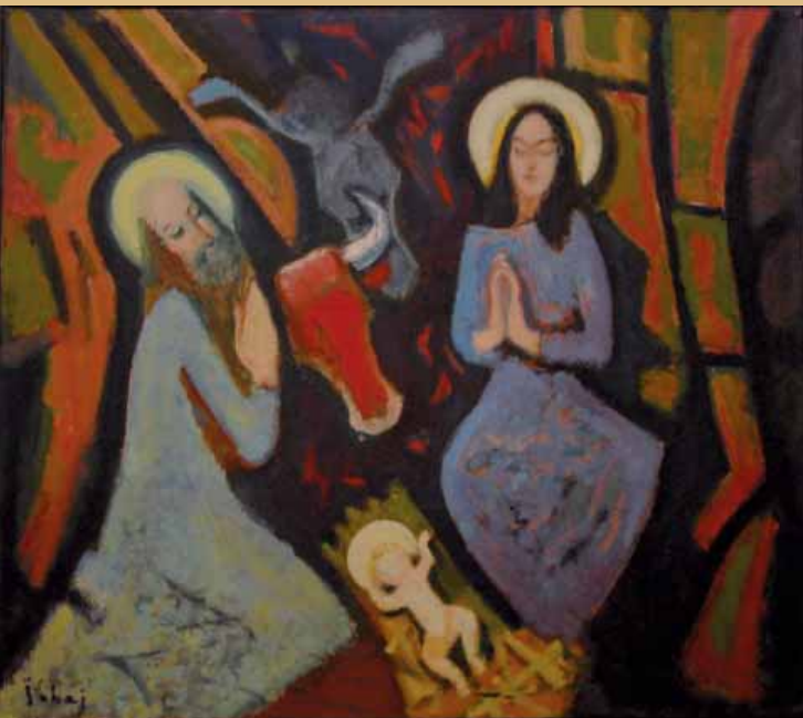
Slavko Šohaj, Rođenje