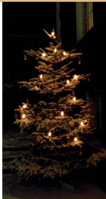
Božićne pjesme u atmosferi sa snijegom, jasicama i borovima daju ovome vremenu toplinu i neku nježnu čežnju prema boljem i iskrenijem svijetu

Danas, vama i Spasitelj. Te tri riječi jesu riječi velikoga dara i riječi te prve pjesme. One su dar neba, istinski dar neba, bez naših zasluga, bez našega traženja pa i bez naših molitava, zaziva, krunica i hodočašća. Onaj koji dolazi, o kojemu pjeva ta prva izvorna božićna pjesma ne treba ništa. Ni naših darova, jer mi smo sve pretvorili u darivanje skupih stvari. Ni naših očekivanja, jer mi očekujemo samo ono što nam odgovara. Ni naših želja, jer smo želje pretvorili u novce i bankovne račune. Ni naših skupova, jer oni veličaju moć, svjetovnu ili crkvenu, svejedno je. On ne treba ništa, i ništa ne traži, jer je darovan odozgor, odakle mi, umišljeni i pobožni kršćani, očekujemo opet korist. I spasenje je postalo stvar koristi, kažu neki što smatraju da “se isplati” vjerovati, pa makar to bilo samo za Božić!