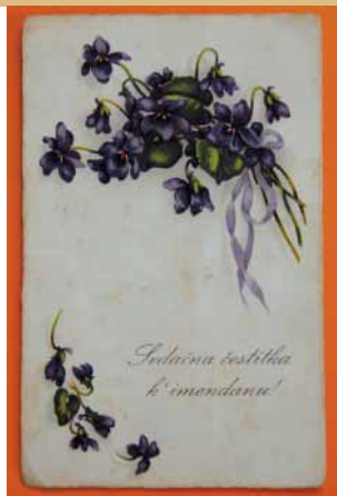
Čestitka za imendan

Božićne čestitke pojavile su se istodobno kad i razglednice i u početku su dobavljane iz inozemstva