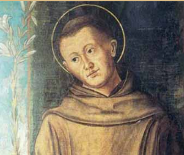
A. da Murano, Sveti Anto