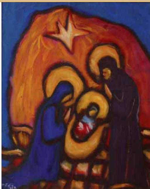
Fra Perica Vidić, Rođenje

Potom su na red došli obrazovani, mudri ljudi s Istoka, istraživači astroloških promjena na nebu, koji slijede neobičnu zvijezdu. Slijedeći zvijezdu oni stižu u Jeruzalem. Tu su svećenici i pismoznanci - oni znaju što piše u Pismima, ali ne idu u Betlehem. Tu je također i