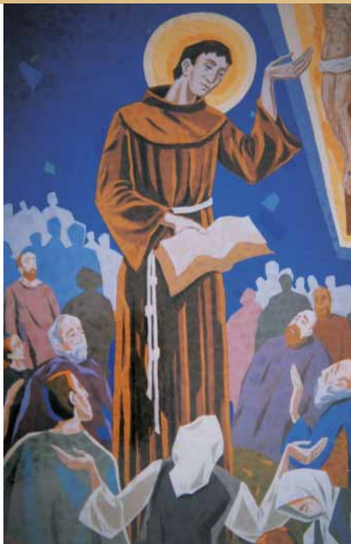
Josip Bifel, Sveti Anto (Gračac)

Potrebno je pojasniti duhovni okvir Antina vremena. Prije svega Anto je svoje dušobrižničko djelovanje počeo koncem 13. stoljeća. Anto je sin svoga vremena i po religioznoj i kulturnoj izobrazbi. U to vrijeme među učenim ljudima bile su u trendu patrističke težnje. U to se doba propovijed zasnivala isključivo na Sv. pismu. Propovijed je redovito pobuđivao citat Sv. pisma jer se u to doba Sv. pismo držalo jednim izvorom svete i teološke nauke. Svetopisamski se citat nazivao „autoritetom“ jer je kao Riječ Božja u sebi sadržavao snagu dokaza priopćavanog učenja. I Anto se držao te metode i zato njegovi govori isključivo obrađuju Sv. pismo. Cilj mu je