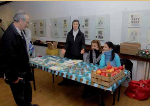
Mali božićni sajam