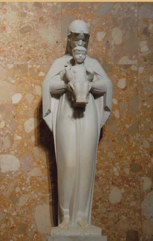
Franjo Kršinić, Majka s Djetetom