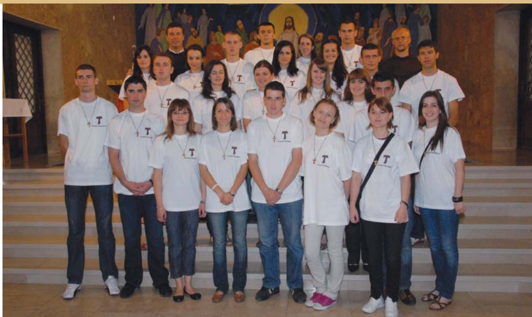
Članovi franjevačke mladeži u Sarajevu

Drugo, Franjo je Asiški na svoj način bio prorok svoga vremena. Međutim, njegov proročki žar nije se u svetlo ljutnji pretvarao u oštre riječi suda. Kod Franje se, doduše, osjeća izvjesna kritička oštrina prema životnoj praksi vremena. Ali Franjo ni izdaleka nema one ubojite oštrine riječi kakvu su nosile izjave starozavjetnih proroka. U postavljanju prema ljudima Franjo je ponajviše kritičan prema sebi i tako vlastitom životnom praksom postaje najradikalnijom kritikom i drugima, ali i tada više kao poziv, a manje kao prijetnja. U tom smislu Franjo je posve sličan Isusu u kojega doista veoma malo susrećemo vanjsku kritiku ljudi. Zapravo bi se moglo reći da Franjo prvenstveno svojom osobom i životom pokušava promijeniti ljude i svijet. Franjo poštuje slobodu drugoga i odriče se, poput Isusa, svakoga oblika nasilja i prisile.