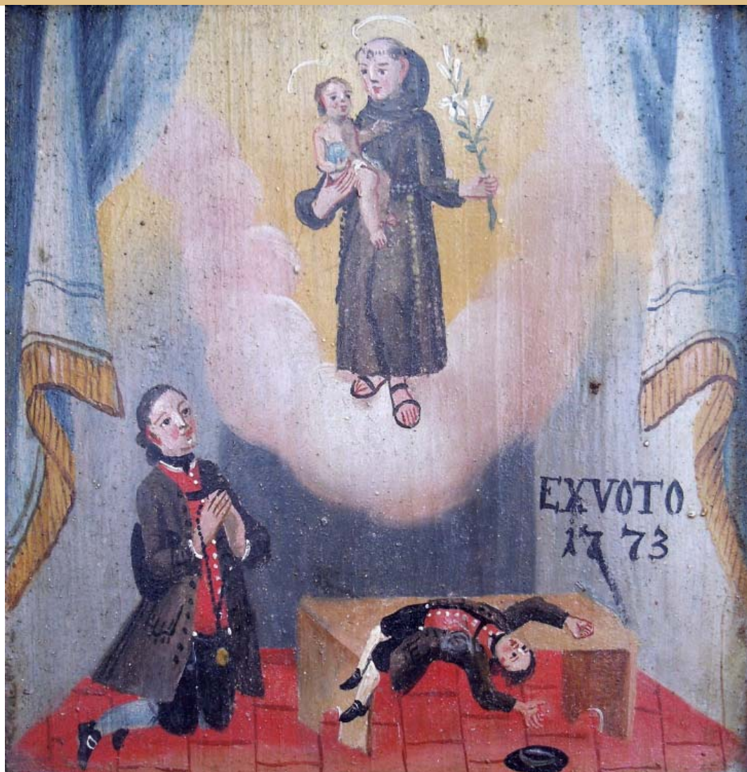
Zavjetna slika iz Haidlfinga